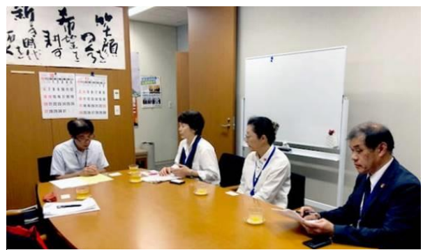
【要請する原告3名と対応する議員秘書(左)】

国会開催中のため、殆ど秘書の方が対応されました。折しも飲酒問題で2度目の業務改善命令が出たこともあり、真剣に話を聞いて下さいました。「頑張っていますね」「大義は皆さんにありますね」「外の宣伝行動が聞こえましたよ」等の嬉しい反応もありました。