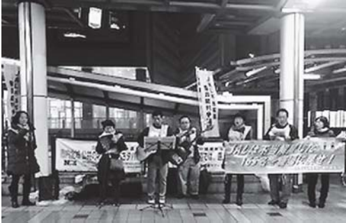
都内立川駅前での宣伝行動。1月28日都内6カ所宣伝

航空業界 は渡航・入国制限、外出 の自粛によって運休、減 便を強いられ、労働者にも 多大な影響を及ぼして います。JAL争議団も 参加される皆さんの安全 や健康を最優先と考え、