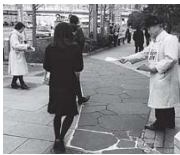
都内の全日空本社前での宣伝