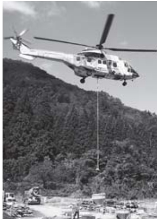
鉄塔工事のため生コンの入った パケットを運ぶヘリ を運ぶヘリ を運ぶヘリ を運ぶヘリ