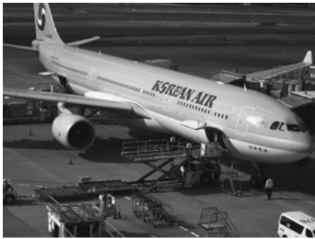
コロナ禍でも黒字経営の大韓航空

大韓航空契約制客室乗務員の雇止め事件は、東京労働委員会に不当労働行為救済申立をしつつ、同時に解決に向けた団体交渉も並行して取り組まれています。