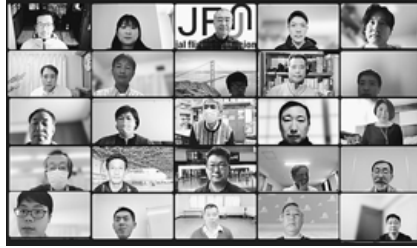
オンラインで参加した代議員のみなさん

航空安全会 議は3月23日 臨時総会を 開催し、20 22年総合安全 要請を決定 しました。 開催方式に 関しては、引き続き感 染症による様々な制限 が徐々に緩和され、観光 やビジネス需要が回復傾 向となっております。その 一方で、ロシア・ウクラ イナ情勢の緊迫化によ り、欧州路線の運航に直 接の影響が出ています。 このように世界の状況 や情勢が大きく左右され る中、各団体とも、懸命 に活動してきたことと思 います。再び以前の空の 輝きを取り戻した後も、 引き続き「航空の安全」 が守れるよう安全に対す る声を上げ続けましょ う。