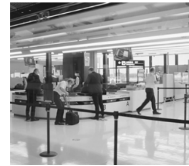
保安検査場で検査を受ける外航クルー。成田空港

として職場内の抗菌処理(順次実施)、③65歳以上の雇用について22年度中に方向性提示、④JAL・SJT制度の失効分の1年延長、⑤育児・休業法改正に伴う制度の見直し、⑥生活と仕事の両立支援へのパワハラ防止措置法に伴う会社方針周知と規程の整備、⑦勤続表彰制度の見直し、⑧勤続40年表彰を検討、⑨インフルエンザ接種の会社補助の継続、⑩テレワーク推進に伴う環境整備(22年度中に方向性提示)などが回答されました。成田で国際線のグラウンドハンドリングを行うJASCOでは、入社1年から3年目を対象に1000円の賃上げ回答がありました。外航では、2009年から年俸制に移行しているキャセイ航空労組は1・5%の賃上げ、ノースウエスト航空労組は2・5%の賃上げ、JALは約2%の賃上げ、ANAは約1%の賃上げを提示しています。外航・産業航空交渉本格化へ