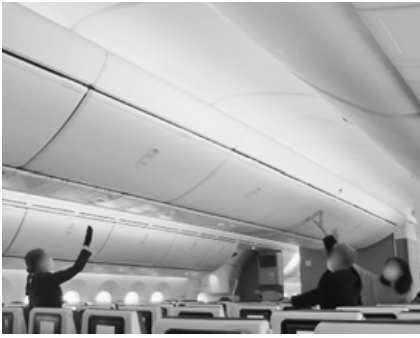
出発前に収納棚を点検する客室乗務員