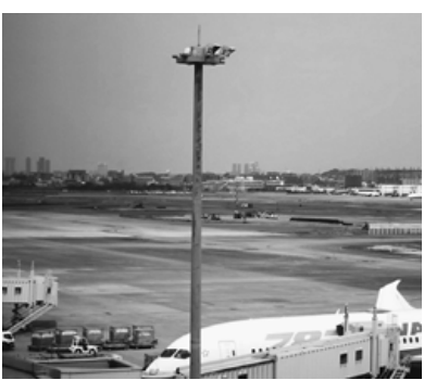
第2滑走路増設工事が進む福岡空港

労働相談は航空連に 03-3742-3251 e-mail/honbu@kohkuren.org