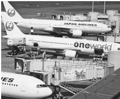
コロナ禍から回復する日本航空