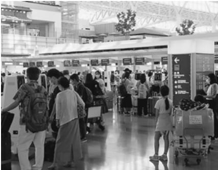
便で旅客が急増する外航。羽田空港第3ターミナル